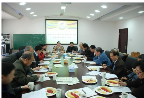
2011年全国组委会会议