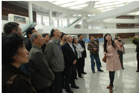
全国组委会成员在天津考察