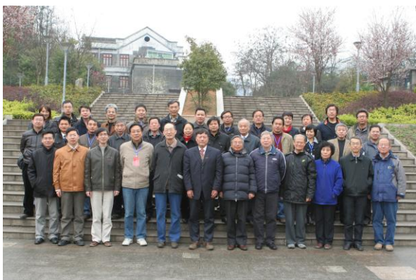
2011年命题研讨会专家合影